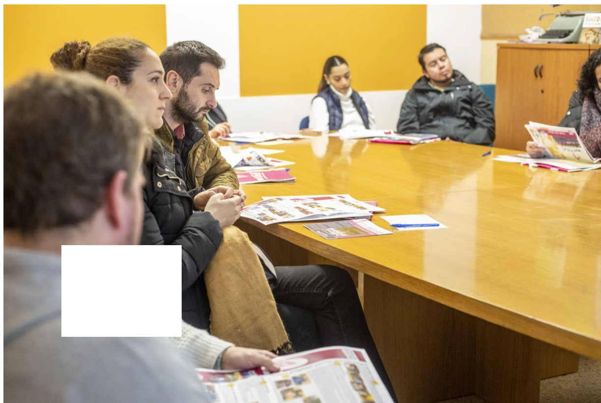
Colegios e institutos celebran jornadas de puertas abiertas para ofrecer información detallada de su oferta educativa.

Los padres de alumnos de segundo ciclo de Infantil, Primaria, ESO y Bachillerato participan en las jornadas de puertas abiertas de colegios e institutos antes de presentar una solicitud de plaza