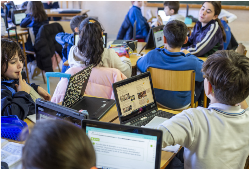
Colegios e institutos celebran jornadas de puertas abiertas para ofrecer información detallada de su oferta educativa.

El delegado de Educación, Ángel Fernández-Montes, presentó esta semana la oferta de plazas disponibles para el próximo curso escolar con más de 15.000 vacantes provisionales: 3.636 para Infantil, 4.494 para Primaria, 4.324 para ESO y 2.708 para Bachillerato.